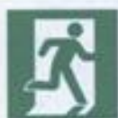
E 01-02 Выход здесь